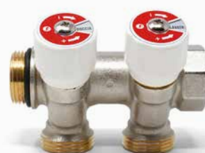
Variante collettore a 2 stacchi