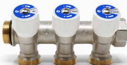
Variante collettore a 3 stacchi